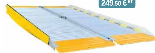
Plateforme pour rampe Équerre