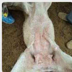
Rougeur et boutons sur le ventre