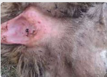
Rougeur et petits boutons à la base de la queue